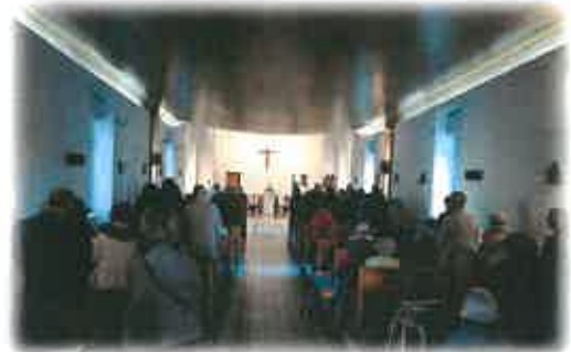
Saint Charles 2019

Pour la Saint Charles, la Fondation Pauliani et ELIOR vous concoctent une journée spéciale.