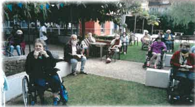
Souvenir de l'apéritif « Socca bella »